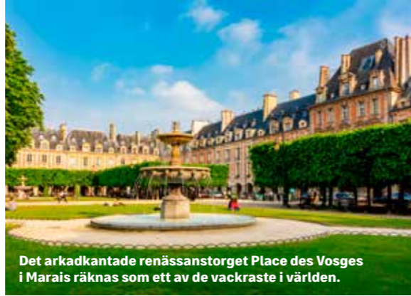
Det arkadkantade renässansstorget Place des Vosges i Marais räknas som ett av de vackraste i världen.