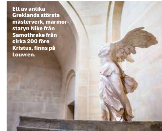
Ett av antika Greklands största mästerverk, marmorstatyn Nike från Samothrake från cirka 200 före Kristus, finns på Louvren.