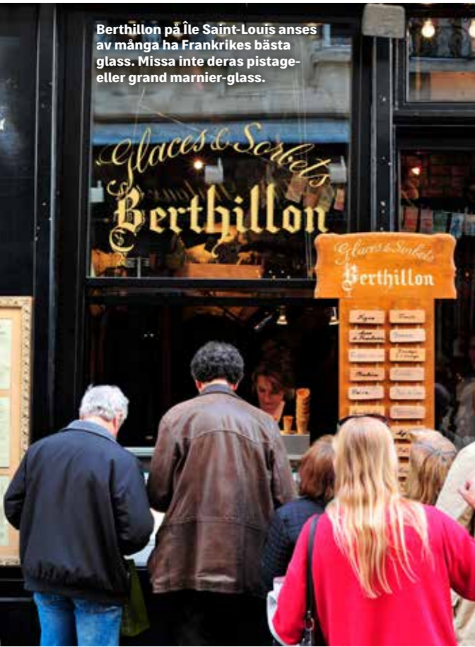
Berthillon på Île Saint-Louis anses av många ha Frankrikes bästa glass. Missa inte deras pistage- eller grand marnier-glass.