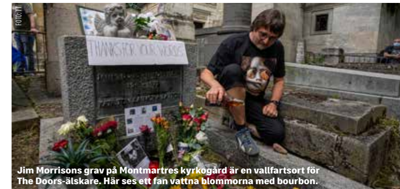
Jim Morrisons grav på Montmartres kyrkogård är en vallfartsort för The Doors-älskare. Här ses ett fan vattna blommorna med bourbon.