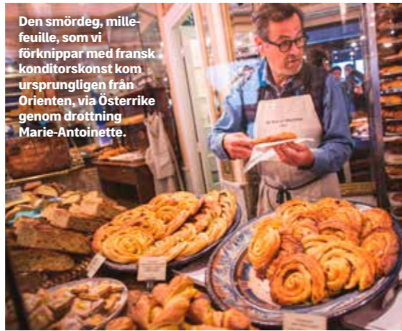
Den smördeg, mille-feuille, som vi förknippar med fransk konditorskonst kom ursprungligen från Orienten, via Österrike genom drötnings Marie-Antoinette.