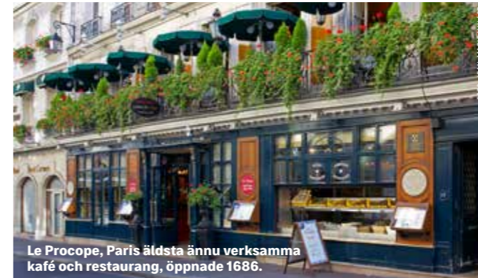
Le Procope, Paris äldsta ännu verksamma kafé och restaurang, öppnade 1686.