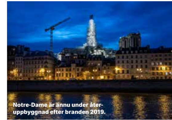
Notre-Dame är ännu under återuppbyggnad efter branden 2019.