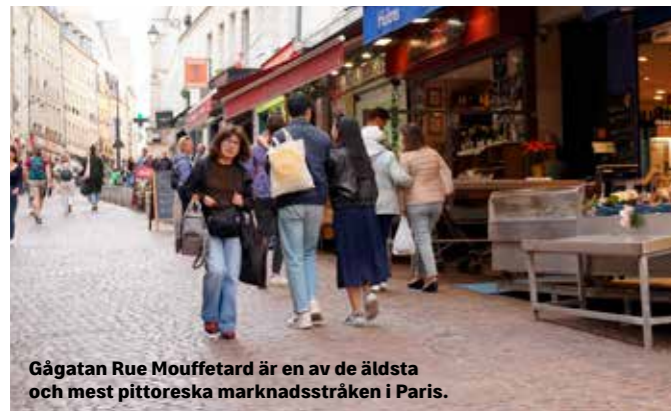
Gågatan Rue Mouffetard är en av de äldsta och mest pittoreska marknadsstråken i Paris.