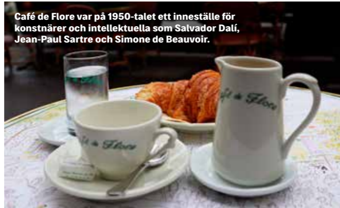
Café de Flore var på 1950-talet ett ineställe för konstnärer och intellektuella som Salvador Dalí, Jean-Paul Sartre och Simone de Beauvoir.