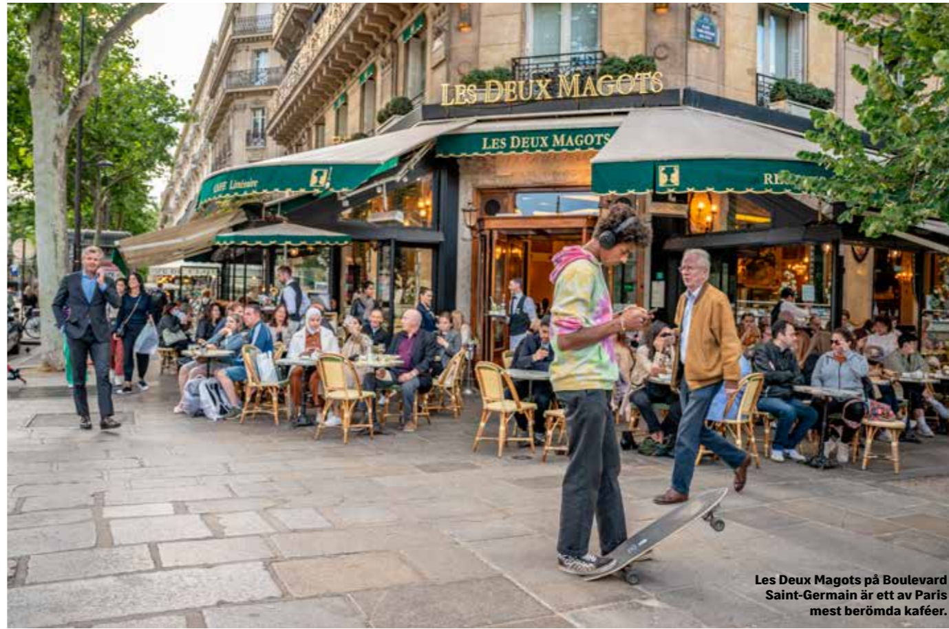
Les Deux Magots på Boulevard Saint-Germain är ett av Paris mest berömda kaféer.